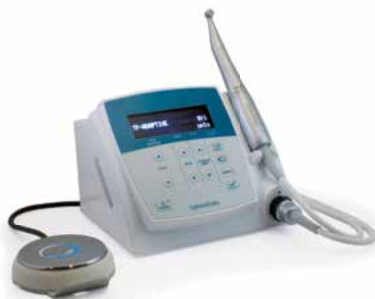
Elements Motor (815-1502)