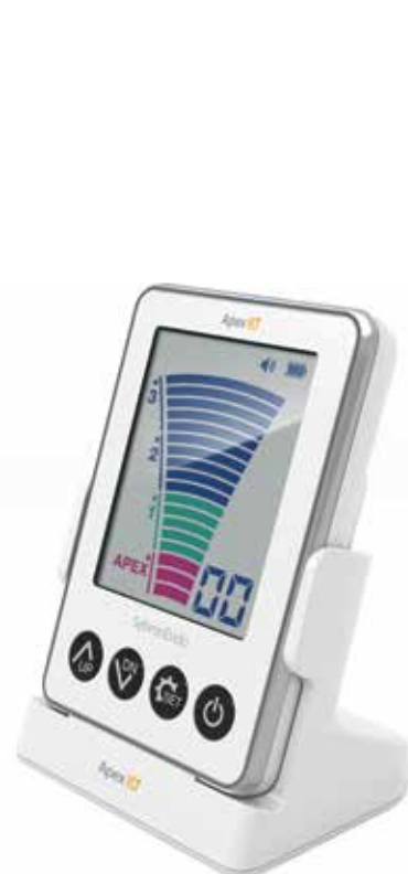
Apex ID (972-0090)

Kompletny zestaw, pozwalający efektywnie przeprowadzić trzy etapy leczenia endodontycznego – od diagnostyki, przez opracowanie, po płukanie kanału.