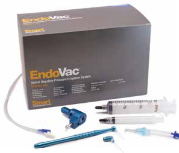
EndoVac Starter Kit (973-3036)